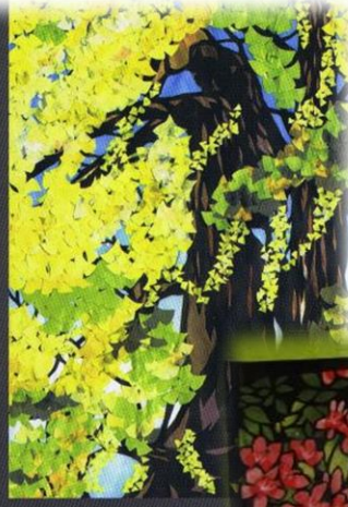
名張風物詩100景より「花笥」左上、「秋（積藤堂邸）」左下右、「小波田川の水門」右上